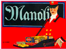
affiche, Hans Rudi ERDT, 1911