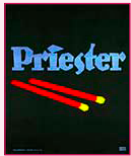
affiche, Lucian BERNHARD, 1906

nouveau type d'affiche publicitaire créé par Lucian BERNHARD en 1906 aussi appelé Plakatstil , Affiche-objet ou Objectivité informative