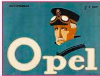
affiche, Hans Rudi ERDT, 1911