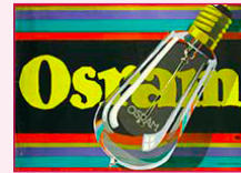
affiche, Lucian BERNHARD, 1919