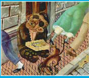
Le vendeur d'allumettes, Otto DIX, 1920

mouvement artistique sans programme ni manifeste qui prône le retour au réel et au quotidien