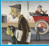
Profanation d'ouvrage, George SCHOLTZ, 1921