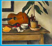
Nature morte à la guitare, Alexander KANOLDT, 1926