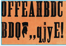
poème, Raoul HAUSMANN, 1918