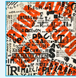
affiche, Kurt SCHWITTERS, 1922