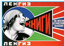
affiche, Alexandr RODTCHENKO, 1924