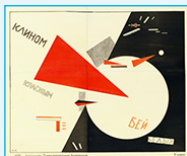
affiche, EL LISSITZKY, 1920

mouvement artistique fondé en 1917 par Alexandr RODTCHENKO art officiel de la révolution russe de 1917 à 1921