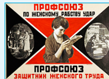
affiche, Alexandr RODTCHENKO, 1925