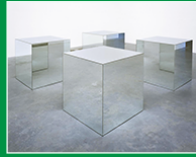
sculpture, Robert MORRIS, 1965