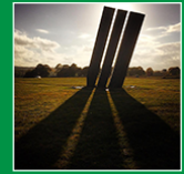
sculpture, Albert HIRSCH, 1994