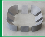
sculpture, Robert MORRIS, 1972