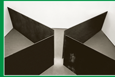
sculpture, Richard SERRA, 1972