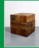
sculpture, Carl ANDRE, 1977