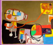
peinture, Corneille, 1950