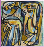
peinture, Asger JORN, 1948

mouvement artistique collaboratif et organique