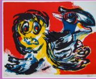
peinture, Karel APPEL, 1965