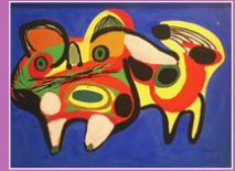
lithographie, Karel APPEL, 1983