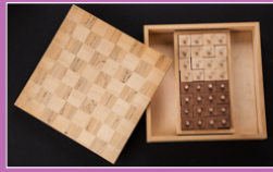
objet olfactif, Takako SAITO, 1965