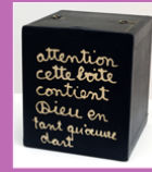
sculpture, Ben, 1966