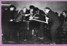
performance, George MA-CIUNAS, Dick HIGGINS, Wolf VOSTELL, Benjamin PATTERSON & Emmett WILLIAMS, 1962