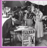
performance, Flea market, Nice, 1963