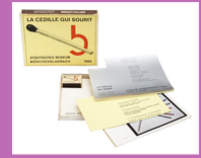
boîte et cartes imprimées, George BRECHT & Robert FILLIOU, 1969