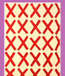
Sans-titre, Louis CANE, 1966