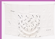
Toile libre, Noël DOLLA, 1969