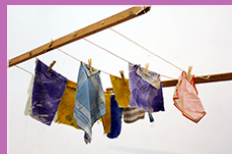
Sans-titre, Noël DOLLA, 1967