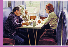
peinture, Ralph GOINGS, 1983