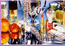
peinture, Audray FLACK, 1974