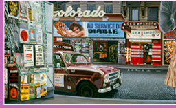
peinture, Jean-Claude MEYNARD, 1975