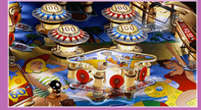
peinture, Charles BELL, 1989