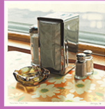
peinture, Ralph GOINGS, 1978