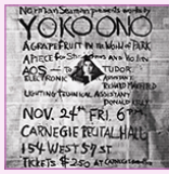
affiche, George MACIUNAS, 1961

productions graphiques issues du mouvement d'anti-art Fluxus