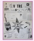
revue, George MACIUNAS, 1976