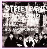
photo, George MACIUNAS, 1961