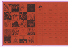
journal Fluxus, anonyme 1966